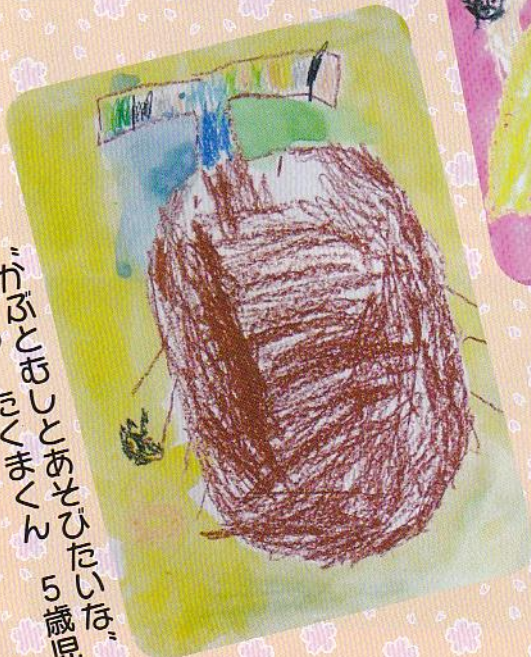
“うらさん” “たべたいな” (あさひ 5歳児)