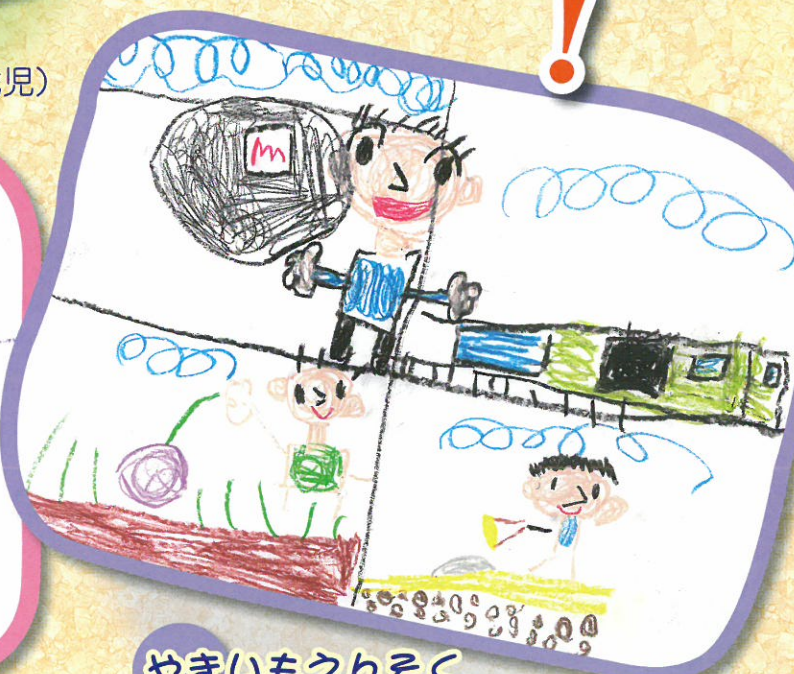
やきいもえんそく (おおき はると 5歳児)