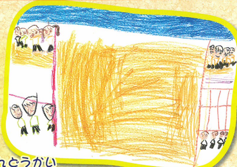
うんどうかい (かいとう こまち 5歳児)