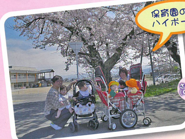
保育園の前でハイポーズ!

今年一年、皆様から賜りました保育園へのご支援、ご協力に感謝申し上げますと共に、ご家族の皆様のご健勝を心よりお祈り申し上げ一年の挨拶に代えさせていただきます。