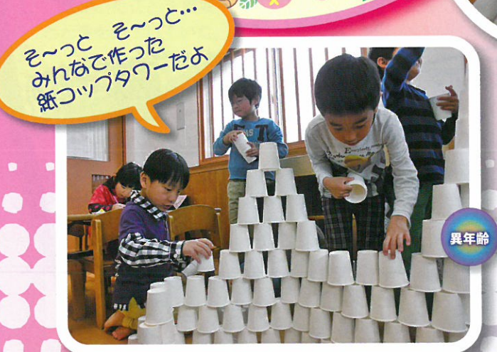
そっつと そっつと... みんなで作った紙コップタワーだよ